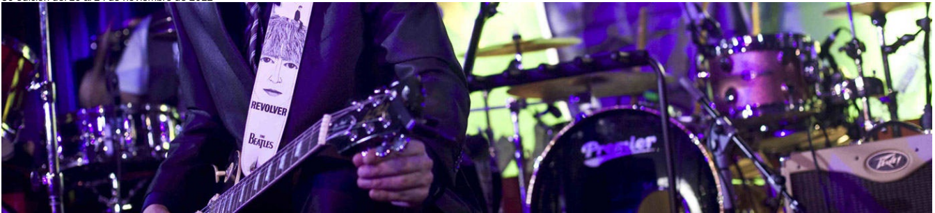
Festival Internacional de Cine de Gijón 50 edición del 16 al 24 de noviembre de 2012