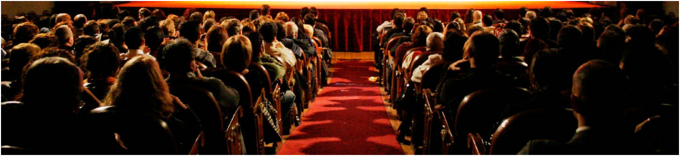
Festival Internacional de Cine de Gijón 50 edición del 16 al 24 de noviembre de 2012